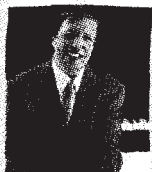
IL PIANISTA L'americano Murray Perahia